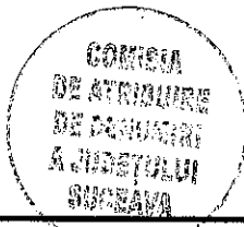
Tabel cuprinzând denumirile străzilor din satul Frătăuții Vechi, com. Frătăuții Vechi, jud. Suceava